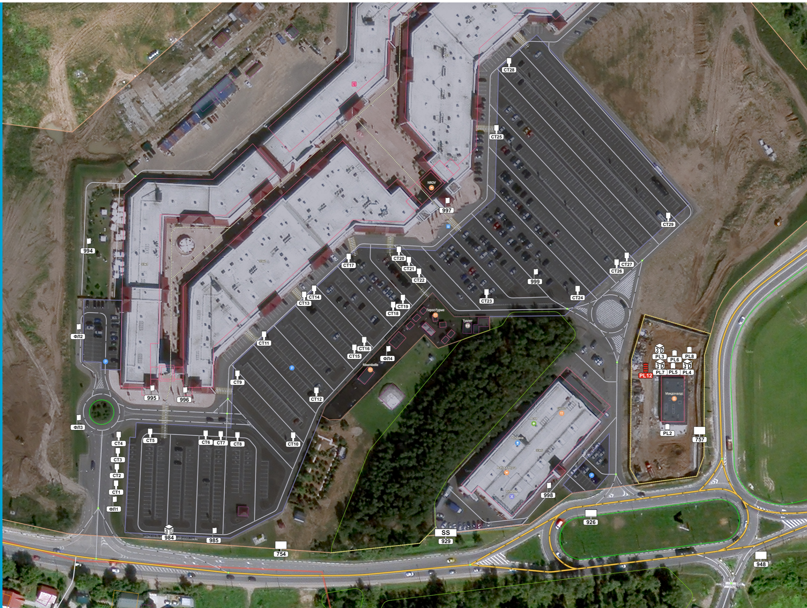
СХЕМА РАЗМЕЩЕНИЯ РЕКЛАМНЫХ КОНСТРУКЦИЙ НА ТЕРРИТОРИИ ГОРОДСКОГО ОКРУГА ИСТРА